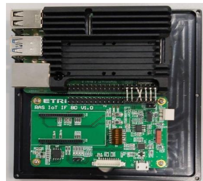
그림 1. IoT 적용 참조 EdgeAI 플랫폼

화재가 발생하기 전 카메라 기반 보행자 인식은 딥러닝을 통해 충분한 보행자 인식이 가능하지만, 연무, 화재 등의 상황에서는 가시광 확보 부족 등으로 인식율 확보가 어렵다. 하지만 mmWave 레이더의 경우 빛과 연기, 그리고 비가 오는 상황에서도 거리가 제한될 수 있지만 요구하는 인식이 가능하다. 따라서, 화재 시 이 두 센서의 융합을 통해 어느정도 인식율 확보가 가능할 수 있다.