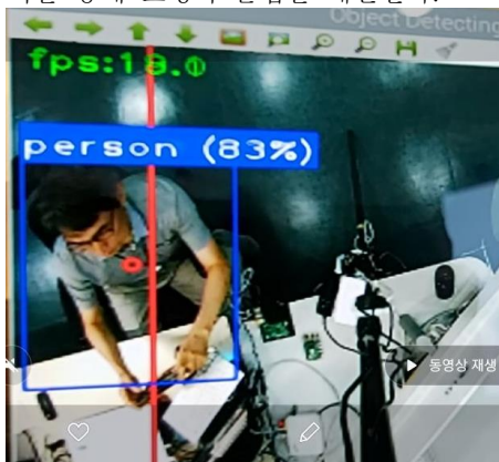
그림 2. 카메라 딥러닝 적용 결과

영상기반 보행자 탐지를 위하여 머신러닝의 필터 적용보다 보다 높은 인식률을 확보할 수 있는 딥러닝을 적용하기 위하여 라즈베리 파이 단말에 HW 기반 가속을 위한 NPU(Neural Process Unit)를 추가하고, SSD-Mobilenet[2] 기반 목표물 탐지(Inference)를 통해 보행자를 검출하며, 검출 결과 프레임 별 검출될 확률을 구할 수 있다. 프레임별 쓰레쉬드 검출 확률을 적용하여, 저비용 HW 와 NPU 를 포함한 EdgeAI 시스템에서 조차 미검출 프레임이 늘어날 경우 검출율은 요구하는 수준에 미치지 못하고, 충분한 보행자 출입을 검출하기 어려워진다. 이를 향상하기 위하여 프레임별 보행자가 검출된 경우 검출 박스 중심부에 대한 칼만 트래킹을 적용하여 비 검출 프레임에서 추적을 통해 보행자의 행동에 대한 지속 검출을 할 수 있으며, 추적 동선이 영역 InOut 쓰레쉬드를 지날 경우 In 과 Out 카운트를 계산하여 영상 기반의 보행자 탐지를 처리한다. 아래 그림 2 에서 적색 라인은 InOut 쓰레쉬드를 표시하고, 중심점 추적을 통해 보행자 출입을 계산한다.